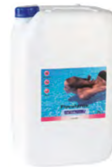
▶ SOLUCIÓN ASTRALPOOL Floculante Líquido