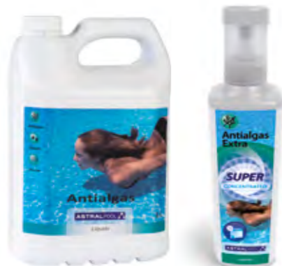
▶ SOLUCIÓN ASTRALPOOL Antialgas abrillantador No espumante. Líquido