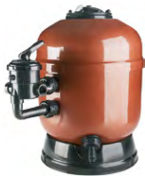
Filtro laminado AstralPool Signature