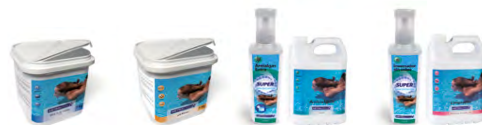
DESINFECCIÓN y MULTIFUNCIÓN