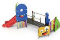
MON-60A Complejo "Valle de los Monsters" Combinaison "Monster Valley" / Combinaison "Val des monstres"