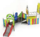
MON-60 Complejo "Monsterland" Combinaison "Monsterland" / Combinaison "Monsterland"