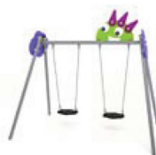
MON 20 - Columpio Monster con 2 asientos / Swing Monster with 2 seats / Balançoire Monster avec 2 sièges