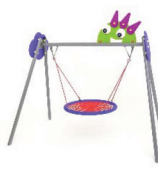
MON 21 - Columpio Monster con asiento cesta / Swing Monster with nest seat / Balançoire Monster avec siège nid d'oiseau