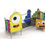
MON-41B Monsters - Senda de Equilibrio con rampa Balance path with ramp / Chemin d'équilibre avec rampe