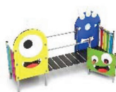
MON-41A Monsters - Senda de Equilibrio Balance path / Chemin d'équilibre