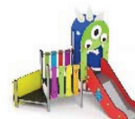
MON-60B Complejo "Montaña de los Monsters" Combinaison "Monster Mountain" / Combinaison "Montagne des monstres"