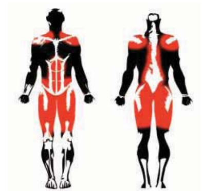
MÚSCULOS EJERCITADOS TRAINED MUSCLES MUSCLES ENTRAÎNÉS