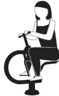
EJECUCIÓN EXECUTION EXÉCUTION