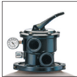
Arena fácilmente accesible gracias al collarín de desmontaje