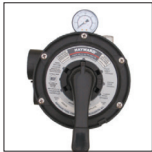
Válvula Vari-Flo™ 6 posiciones