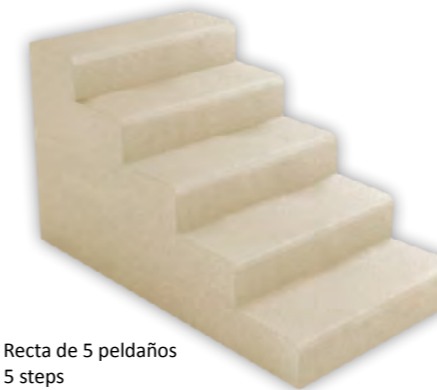
Bloque de Escalera Recta de 5 peldaños Block Straight Stair 5 steps