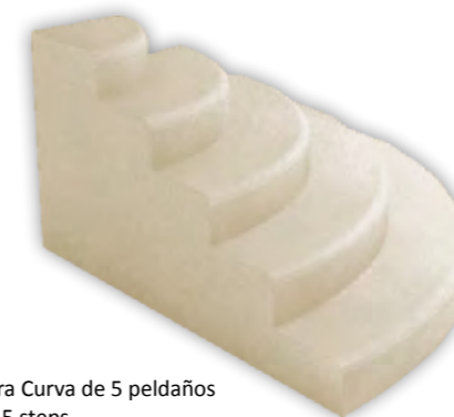
Bloque de Escalera Curva de 5 peldaños Block Curve Stair 5 steps