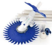
Limpiafondos automático Automatic cleaner 19007